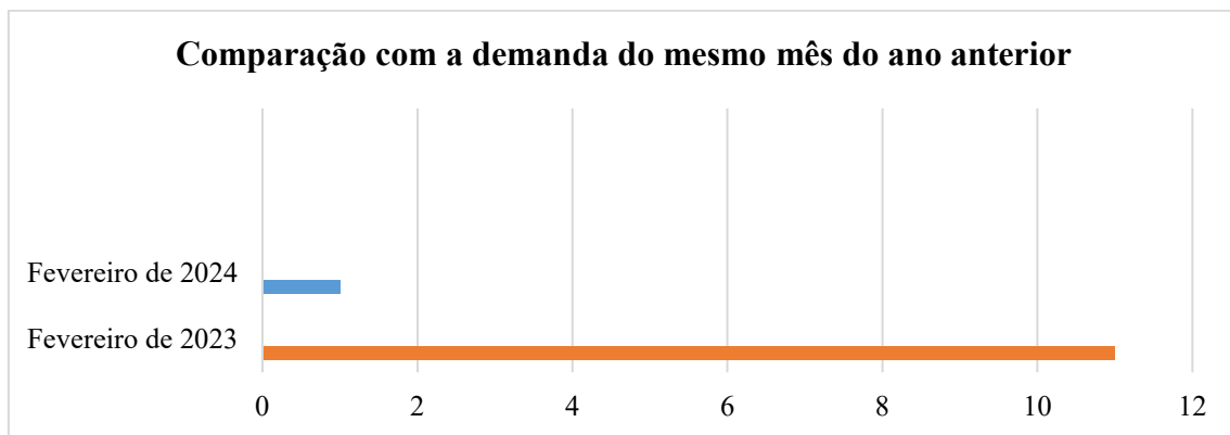
Gráfico 1: Comparação entre a demanda de registro de pedido de informação de FEVEREIRO de 2023 e FEVEREIRO de 2024.

Número de pedidos de informação registrados: 01