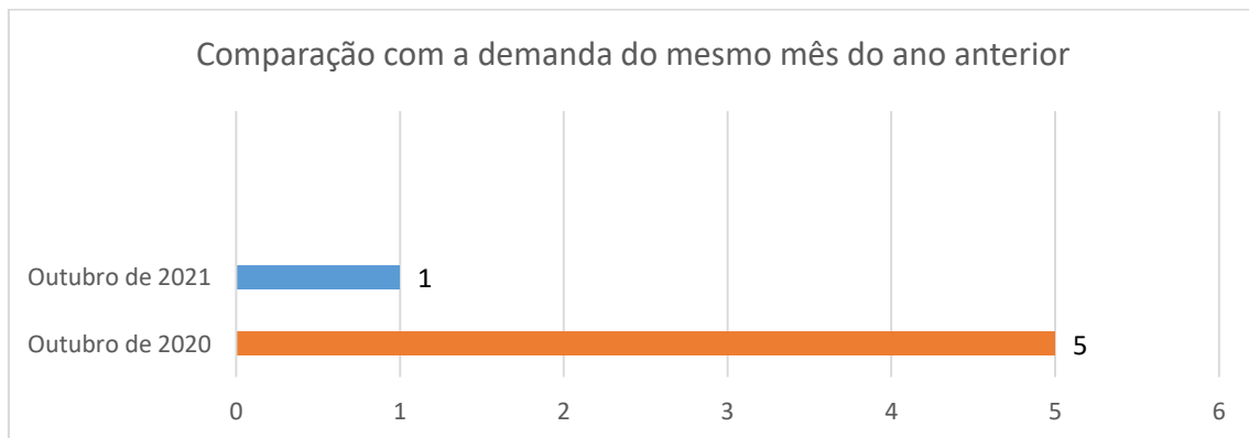
Gráfico 1: Comparação entre a demanda de registro de pedido de informação de OUTUBRO de 2020 e OUTUBRO de 2021.

Número de pedidos de informação registrados: 1