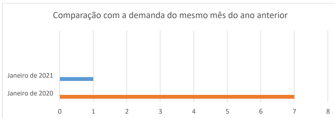
Gráfico 1: Comparação entre a demanda de registro de pedido de informação de Janeiro de 2020 e Janeiro de 2021.

Número de pedidos de informação registrados: 1