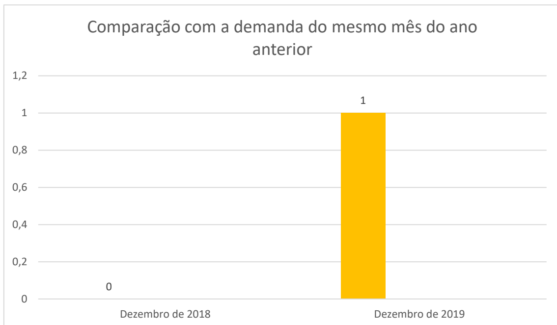
Gráfico 1: Comparação entre a demanda de registro de pedido de informação de DEZEMBRO de 2018 e DEZEMBRO de 2019.