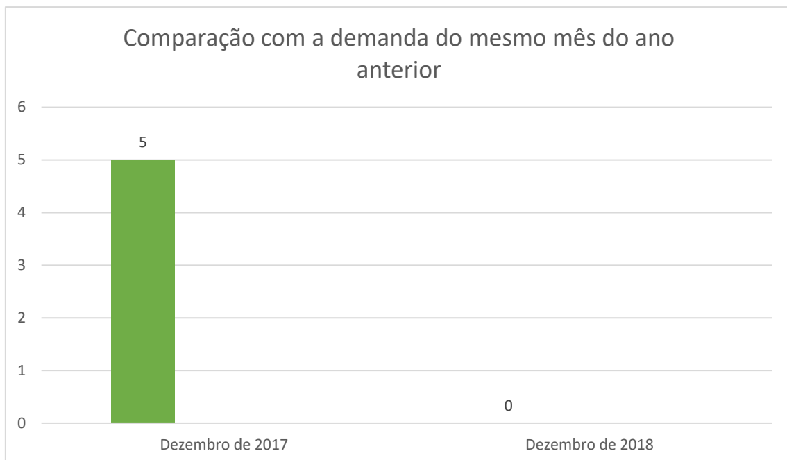
Gráfico 1: Comparação entre a demanda de registro de pedido de informação de dezembro de 2017 e dezembro de 2018.